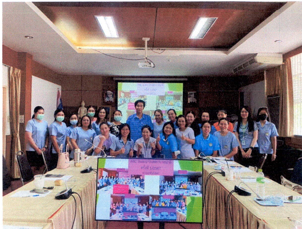
จัดประชุมเชิงปฏิบัติการ