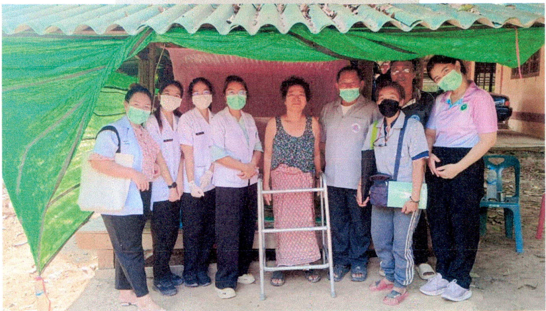
ดำเนินงานธนาคารกายอุปกรณ์เพื่อฟื้นฟูสมรรถภาพทางการเคลื่อนไหวอย่างต่อเนื่อง